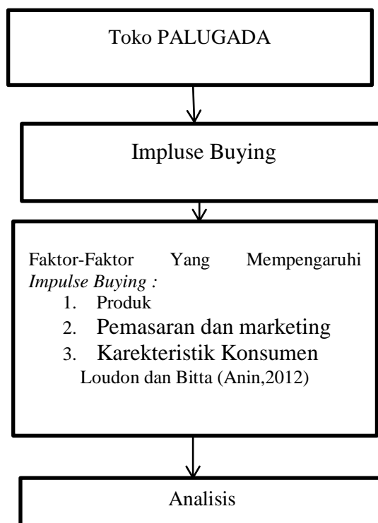
Gambar 2.1 Kerangka Pemikiran